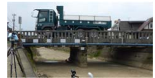
写真-1 車輛走行試験状況

たわみのモニタリングでは、変位計測、画像センシング、サンプリングモアレの3種類の技術を導入した。たわみ計測のうちの変位計測には、変位計とリング式たわみ計、非接触型で遠望測定が可能なレーザーたわみ計の3種類の技術を使用した。振動計測には5種類の技術を使用した。