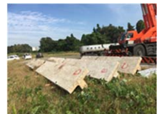
写真-4 撤去桁の外観状況

振動モニタリングについては、振動特性として、加速度センサにより得られた加速度を分析することによって得られる主桁の一次固有振動数等に着眼し、検討を行った。本実証によって検討対象橋梁が構造的には健全であることがわかり、構造的に耐力が低下した状況における一次固有振動数の変化や、それに伴うばらつきの評価は課題として残った。これについては、撤去桁（写真-4）を用いた疲労载荷実験を次年度実施して確認予定である。