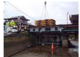
写真-2 静的载荷実験状況

車両走行試験は現像の再現性や季節変動、耐久性等の検討を行うため、3か月毎に計3回写真1～3に示す実験を行った。劣化促進試験は鉄筋の腐食破断を模擬して主鉄筋を切断した後、静的载荷（写真-2）と加振試験（写真-3）を実施した。