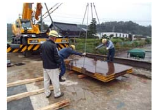
写真-3 加振実験状況

たわみモニタリングについては、3種類のモニタリング技術について、車両重量とたわみの間に強い線形相関がある状況をモニタリングデータとして得ることができた（図-2）ことから、コンクリート桁橋の劣化を評価する技術としての可能性を確認することができた。